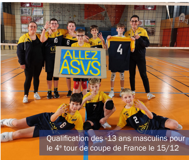
Qualification des -13 ans masculins pour le 4 e tour de coupe de France le 15/12

Cette saison encore, le club a pu engager six équipes en championnats jeunes et six équipes en championnats séniors. Cinq équipes jeunes ont également pu participer à la Coupe de France et, actuellement, les moins de 13 ans masculins ainsi que les moins de 21 ans féminines sont toujours en course.