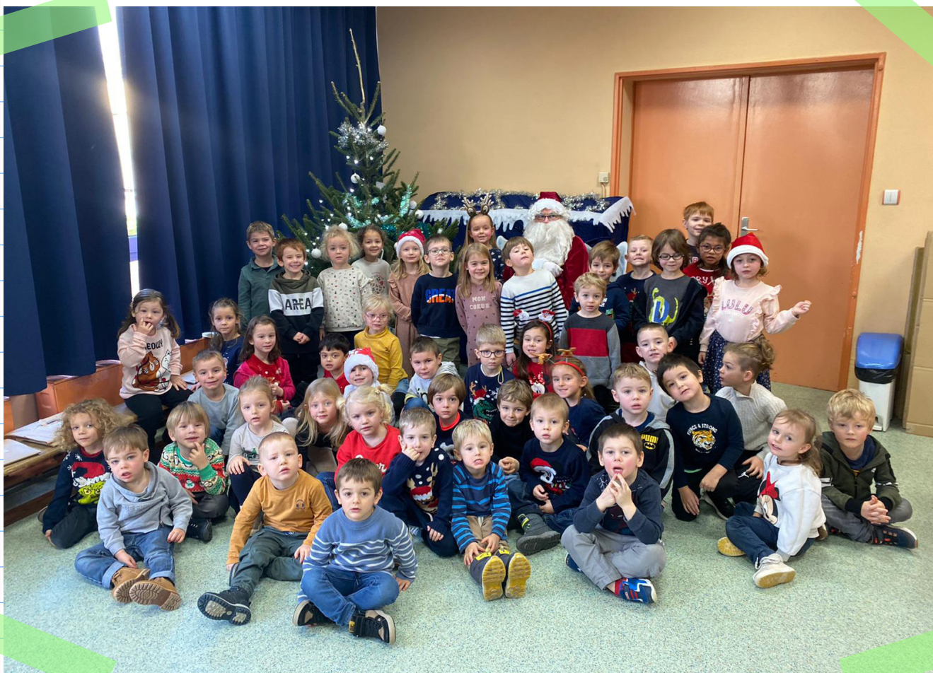
Accueil du père Noël à l'école maternelle le 20 décembre