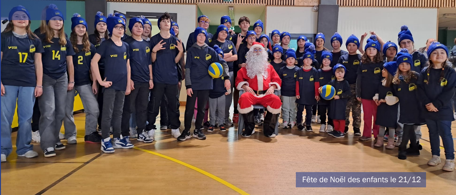
Fête de Noël des enfants le 21/12