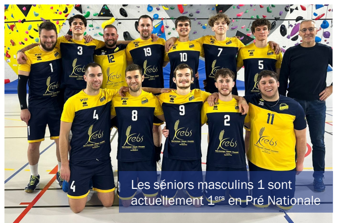
Les séniors masculins 1 sont actuellement 1 ers en Pré Nationale

Du côté des équipes fanions, les féminines, évoluant en Nationale 3, sont actuellement cinquièmes et seul un tout petit point les sépare du leader. Les masculins, quant à eux, réalisent une excellente saison en Pré-Nationale. Ils occupent la première place du classement et sont focalisés sur leur objectif de montée.